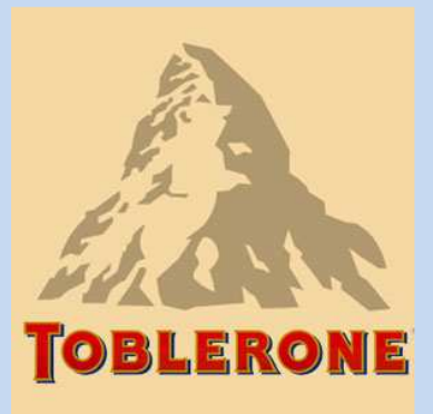
Le Mont Cervin est représenté sur l'emballage des chocolats suisses Toblerone. Les « pics » caractéristiques de cette confiserie rappellent l'identité montagnarde de la Suisse.

L'ascension des différentes faces du Cervin présenta aussi de grands défis pour les alpinistes. La première à être vaincue fut la face nord, escaladée pour la première fois en 1931, exploit qui valut à ses auteurs le Prix olympique d'alpinisme aux Jeux olympiques de Los Angeles de 1932. Quelques mois plus tard, c'est la face sud (face italienne) qui est conquise. En 1932, la dangereuse face orientale est gravie à son tour. En 1962, la face ouest, la plus haute des quatre avec ses 1 400 mètres, est vaincue. Enfin, la face nord-nord-ouest, située entre l'arête de Zmutt et la face ouest (après le Nez de Zmutt, l'ascension se poursuit par l'arête), n'est gravie qu'en 1969 : les deux voies qui la parcourent sont les itinéraires les plus récents et les plus difficiles pour gravir le Cervin. La première face gravie en hiver est la face nord, vaincue le 4 février 1962 par trois cordées suisses et par une température inférieure à -20 °C. Trois ans plus tard, en février 1965, Walter Bonatti est le premier à